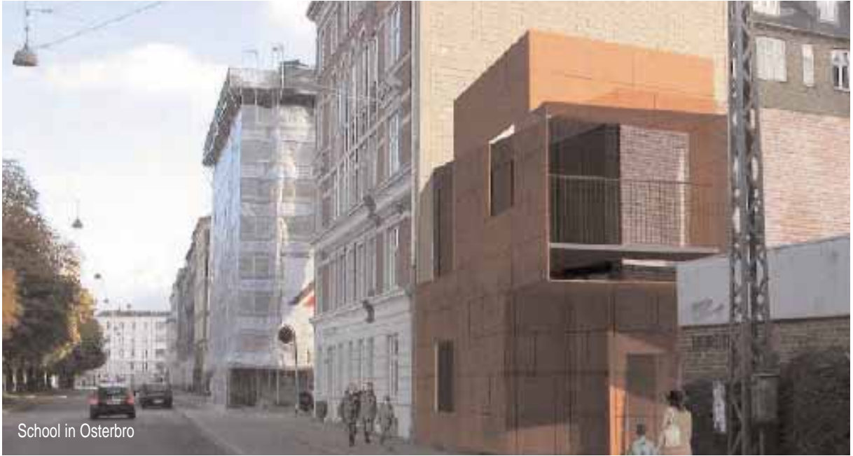
School in Osterbro