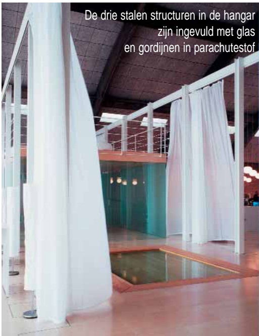
De drie stalen structuren in de hangar zijn ingevuld met glas en gordijnen in parachutestof