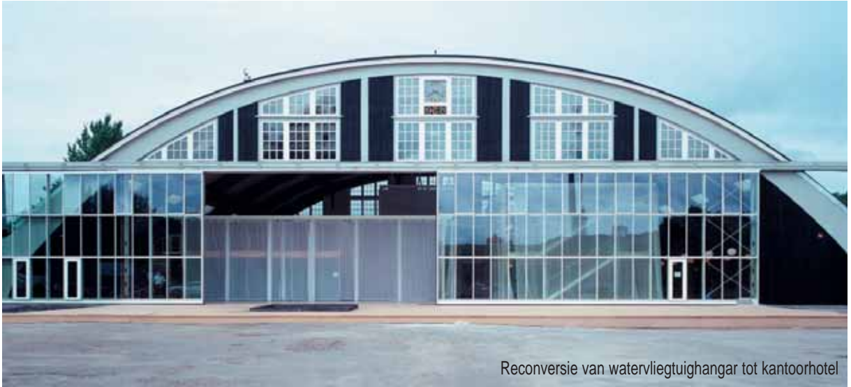
Reconversie van watervliegtuighangar tot kantoorhotel