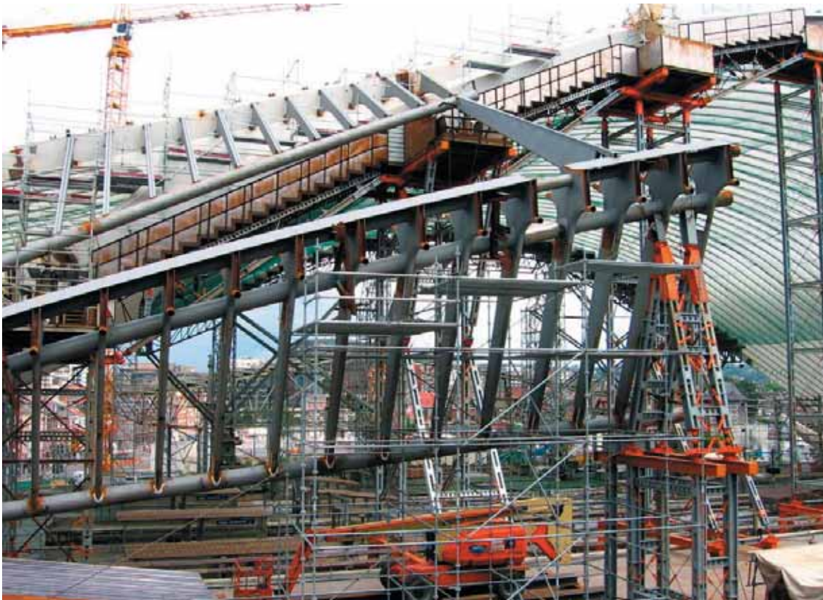
Constructie van de lufte, HST-station Liège Guillemins door Santiago Calatrava.