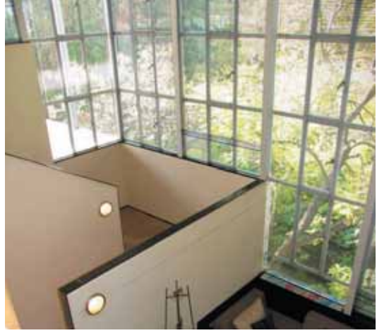
Lovell Health House door Richard Neutra, 1929, Los Angeles.