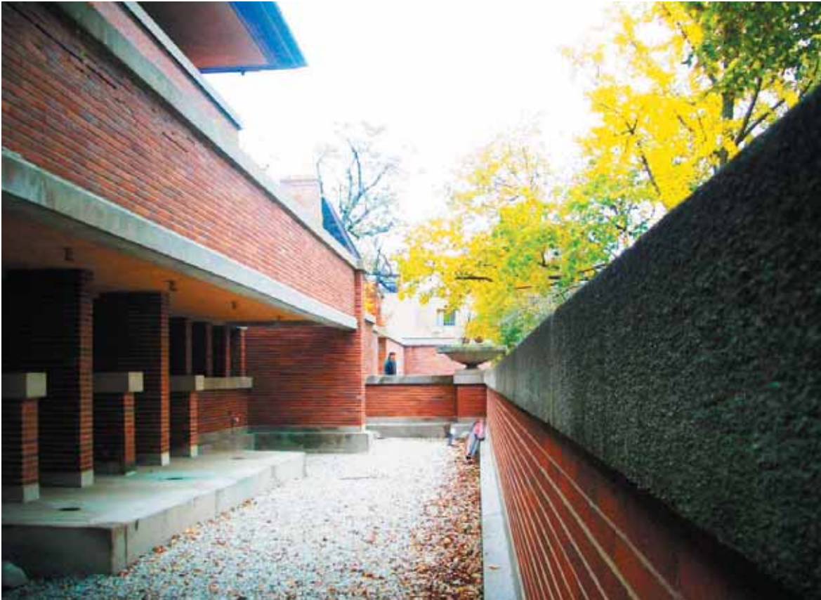
Robie Residence door Frank Lloyd Wright, 1909, Chicago