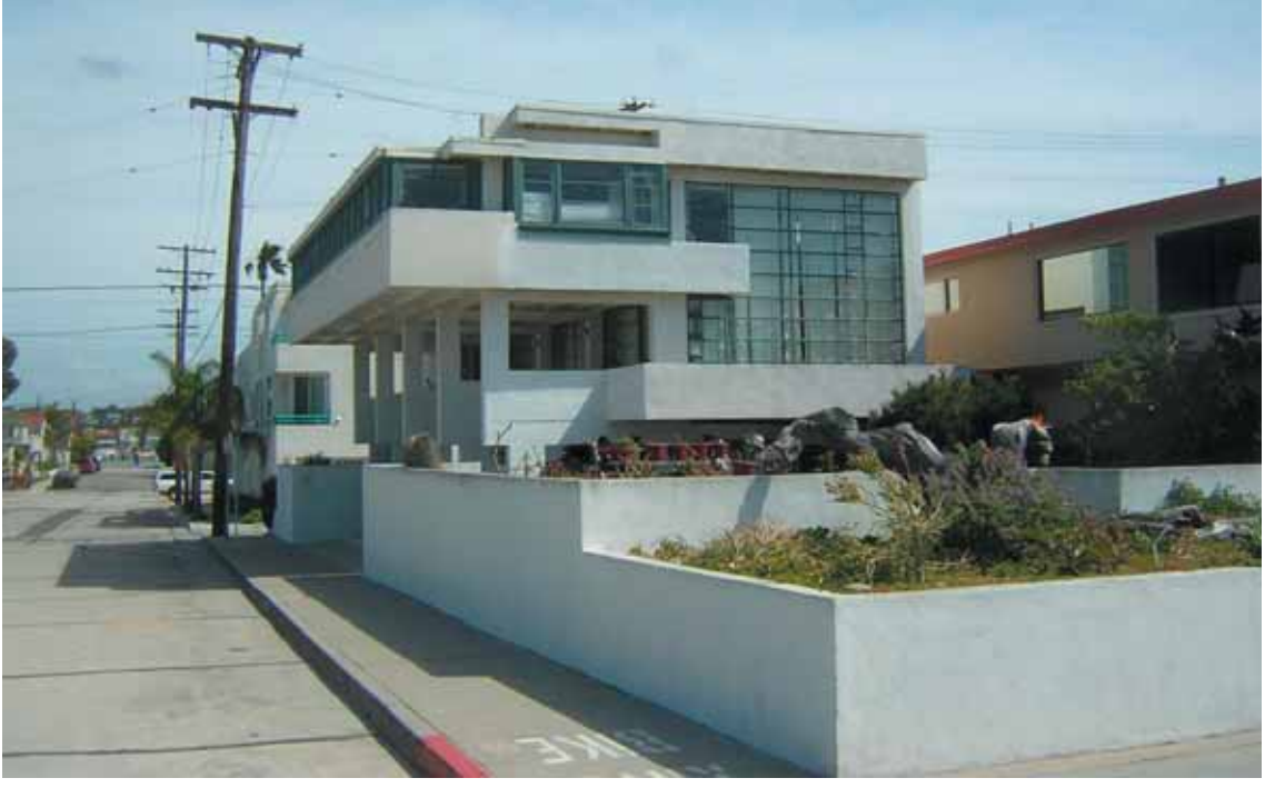
Lovell Beach House door Rudolf M. Schindler, 1926, Newport Beach.