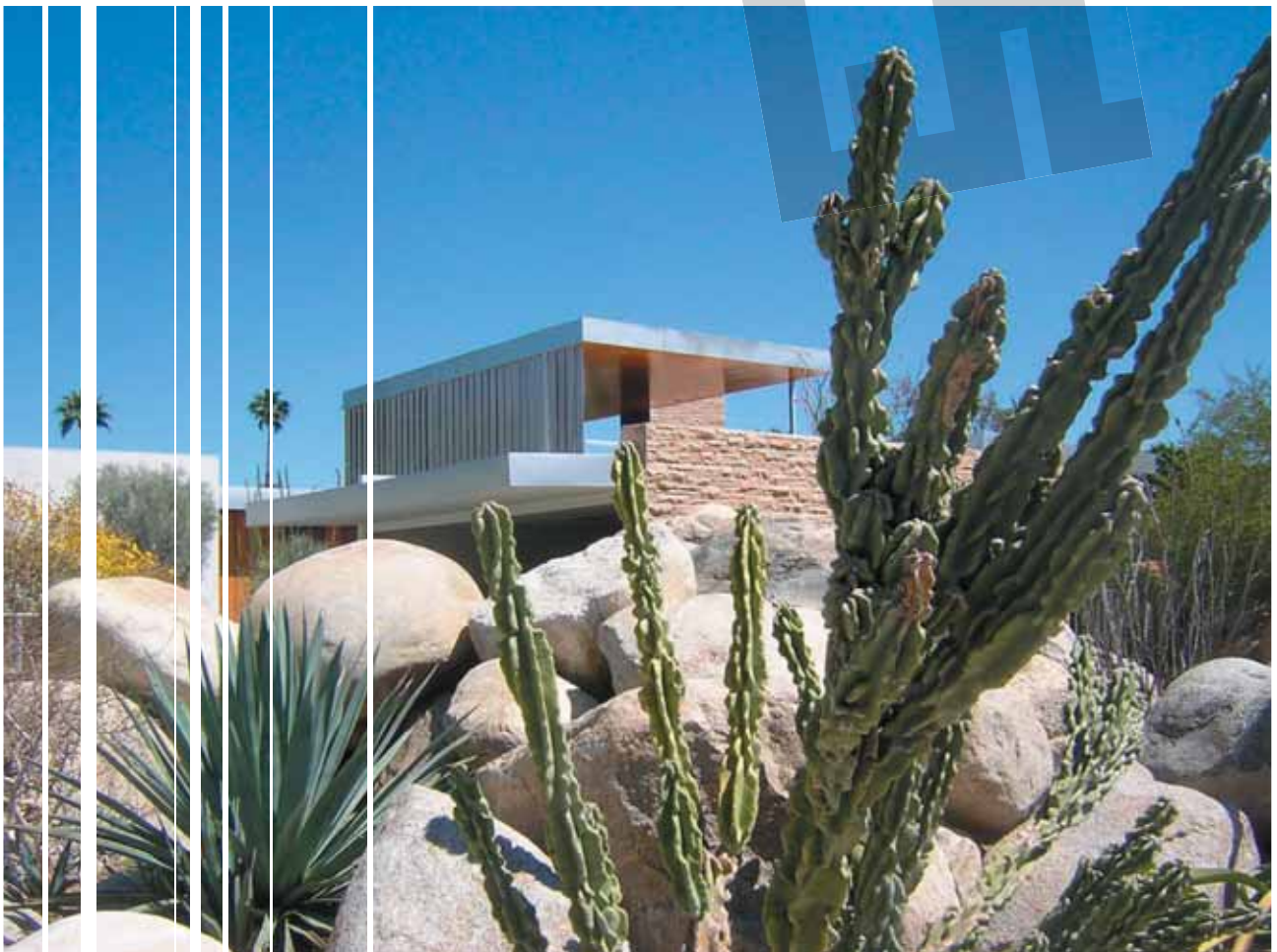
Kaufmann Desert House door Richard Neutra, 1946, Palm Springs.