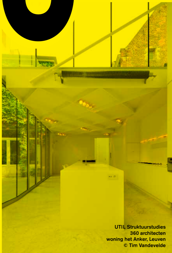
UTIL Strukturstudies 360 architecten woning het Anker, Leuven © Tim Vandevelde

TIJDSTIP 20u00 LOCATIE OC De Leege Platse Geluwestraat 12 – 8980 Beselare