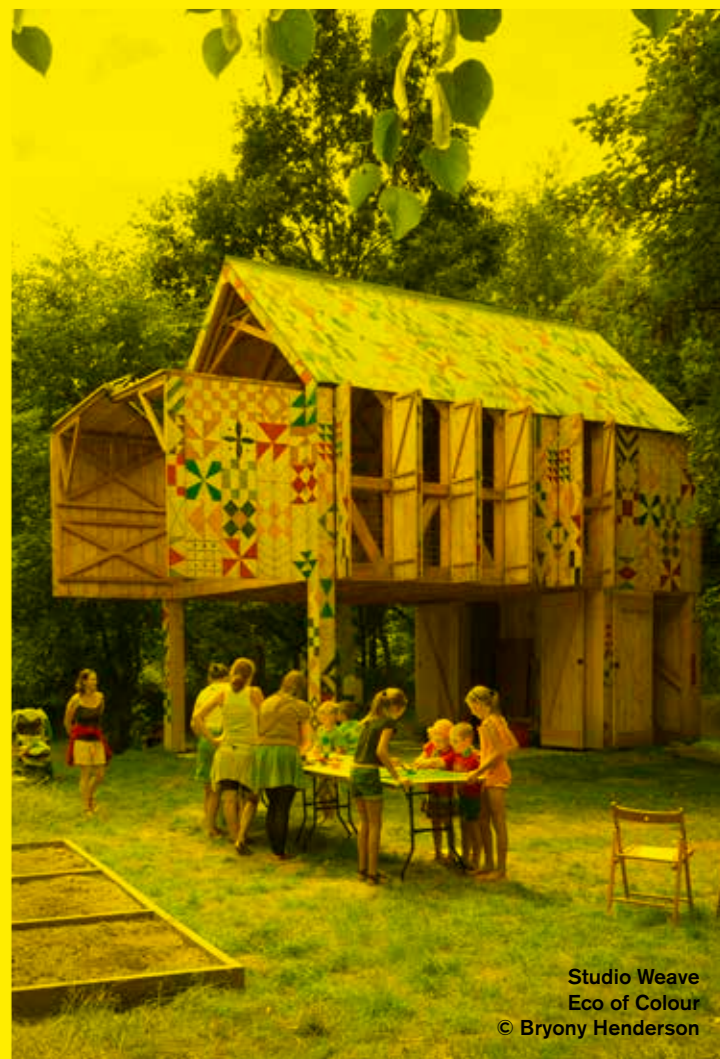
Studio Weave Eco of Colour © Bryony Henderson

SAMENWERKING Designregio Kortrijk, Intercommunale Leiedal