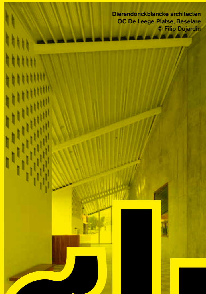
Dierendonckblancke architecten OC De Leege Platse, Beselare