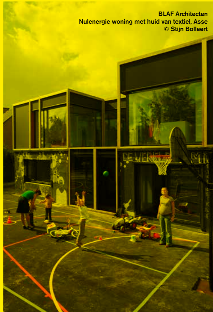
BLAF Architecten Nulenergie woning met huid van textiel, Asse © Stijn Bollaert