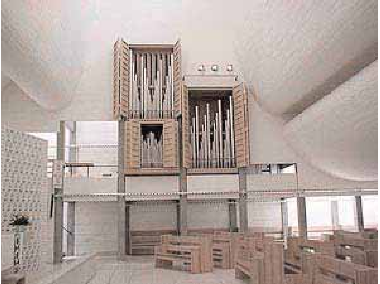
Jørn Utzon: interieur Bagsværd Kerk (1974-1976 )