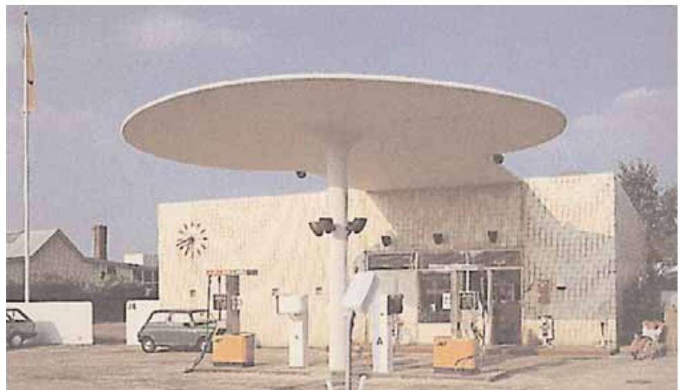
Arne Jacobsen: tankstation Skovshoved (1936-1937)