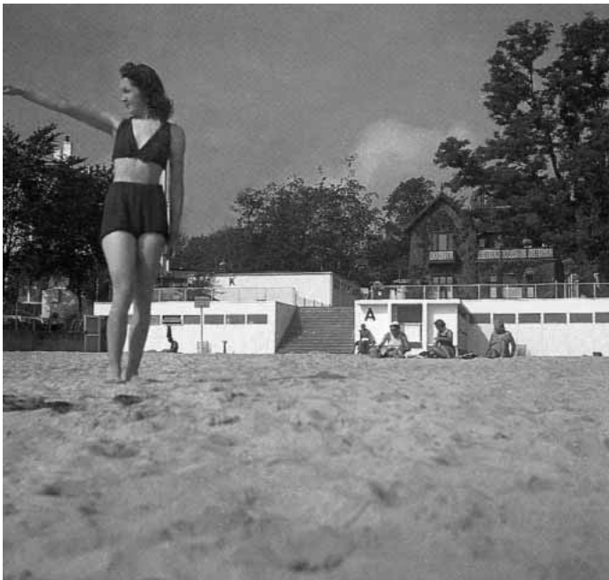
Arne Jacobsen: strandfaciliteiten Klampenborg (1930-1938)