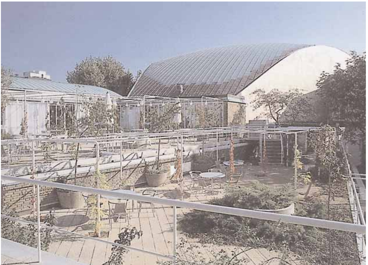
Radiohuset van Vilhelm Lauritzen (1936-1945)