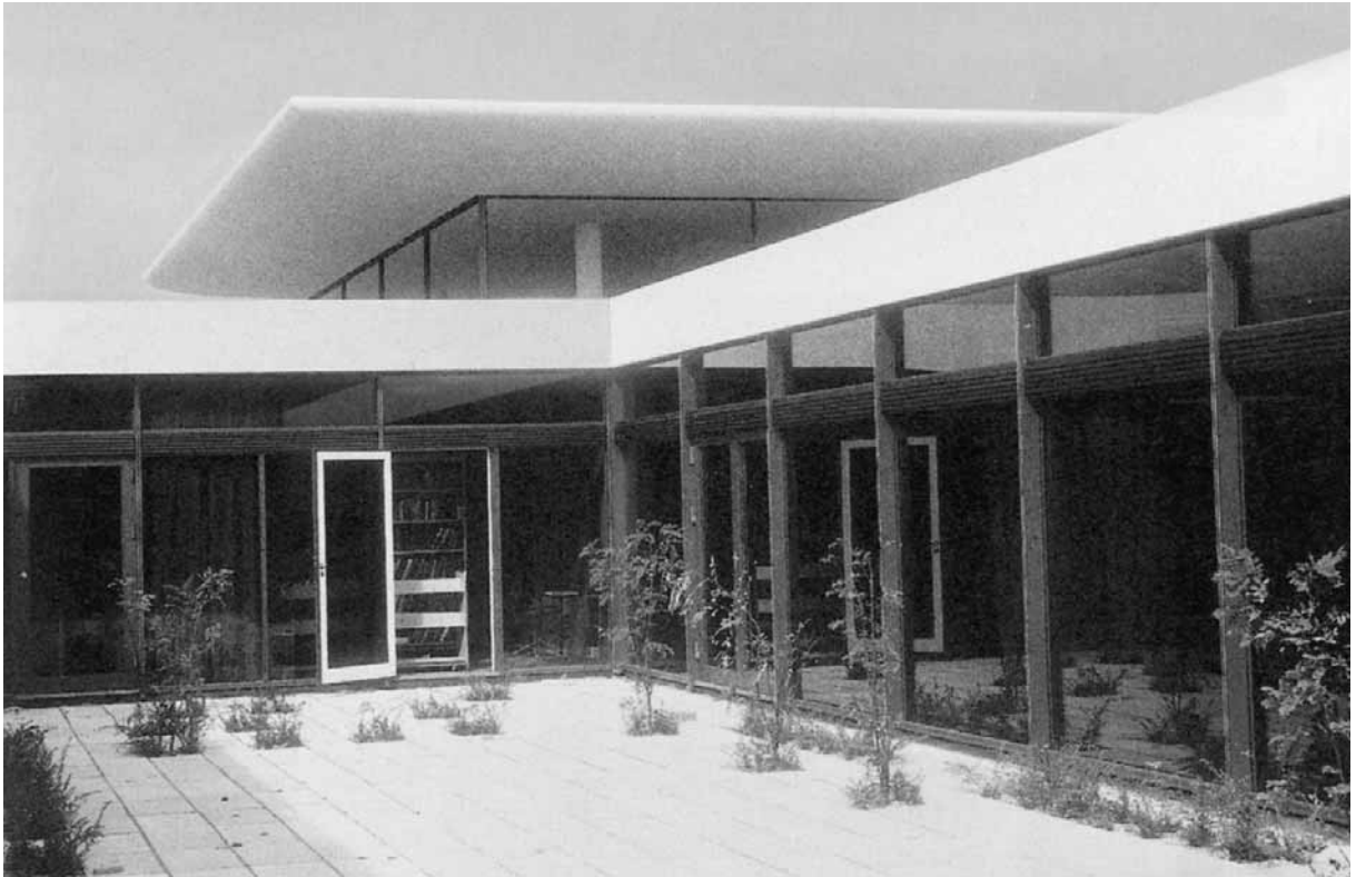
Arne Jacobsen: bibliotheek Rødovre (1961-1969)