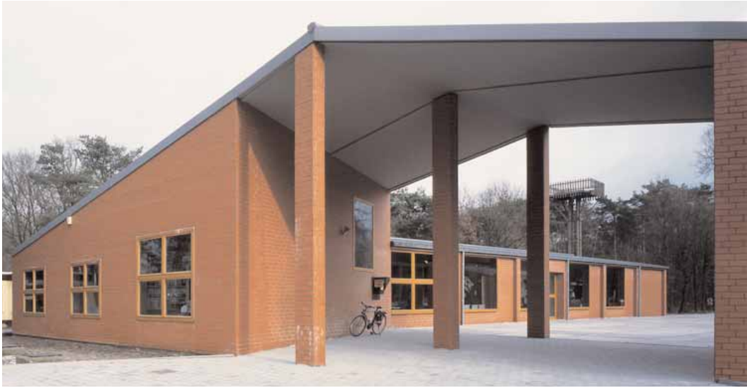
Onthaalgebouw De Hoge Rielen te Kasterlee