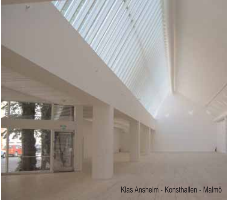
Klas Anshelm - Konsthallen - Malmö