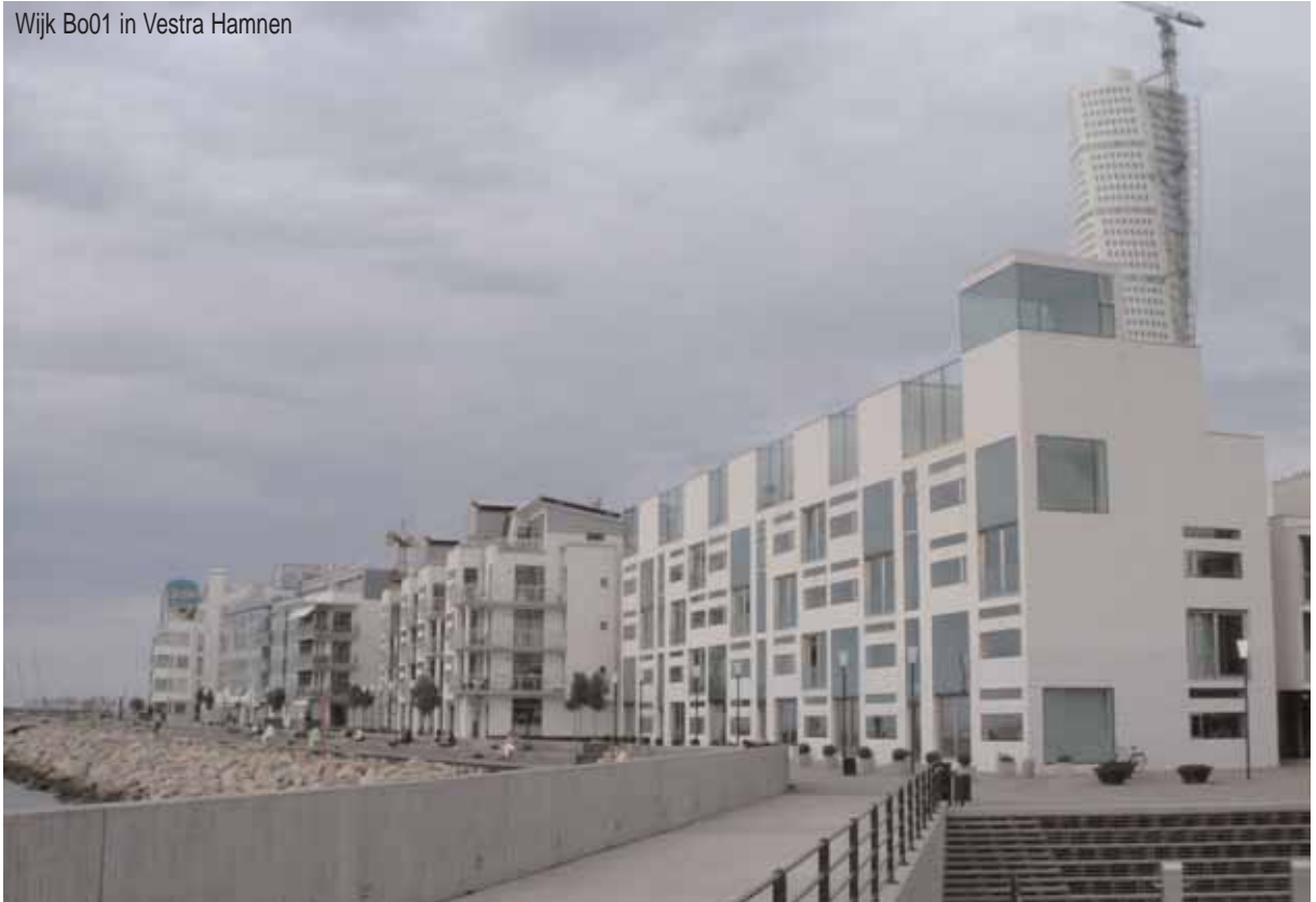
Wijk Bo01 in Vestra Hamnen