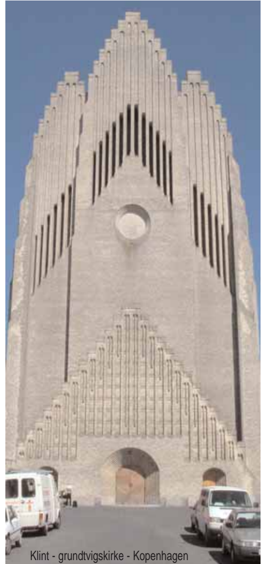
Klint - grundtvigskirke - Kopenhagen