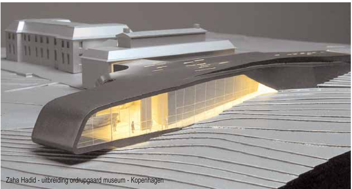
Zaha Hadid - uitbreiding ordrupgaard museum - Kopenhagen