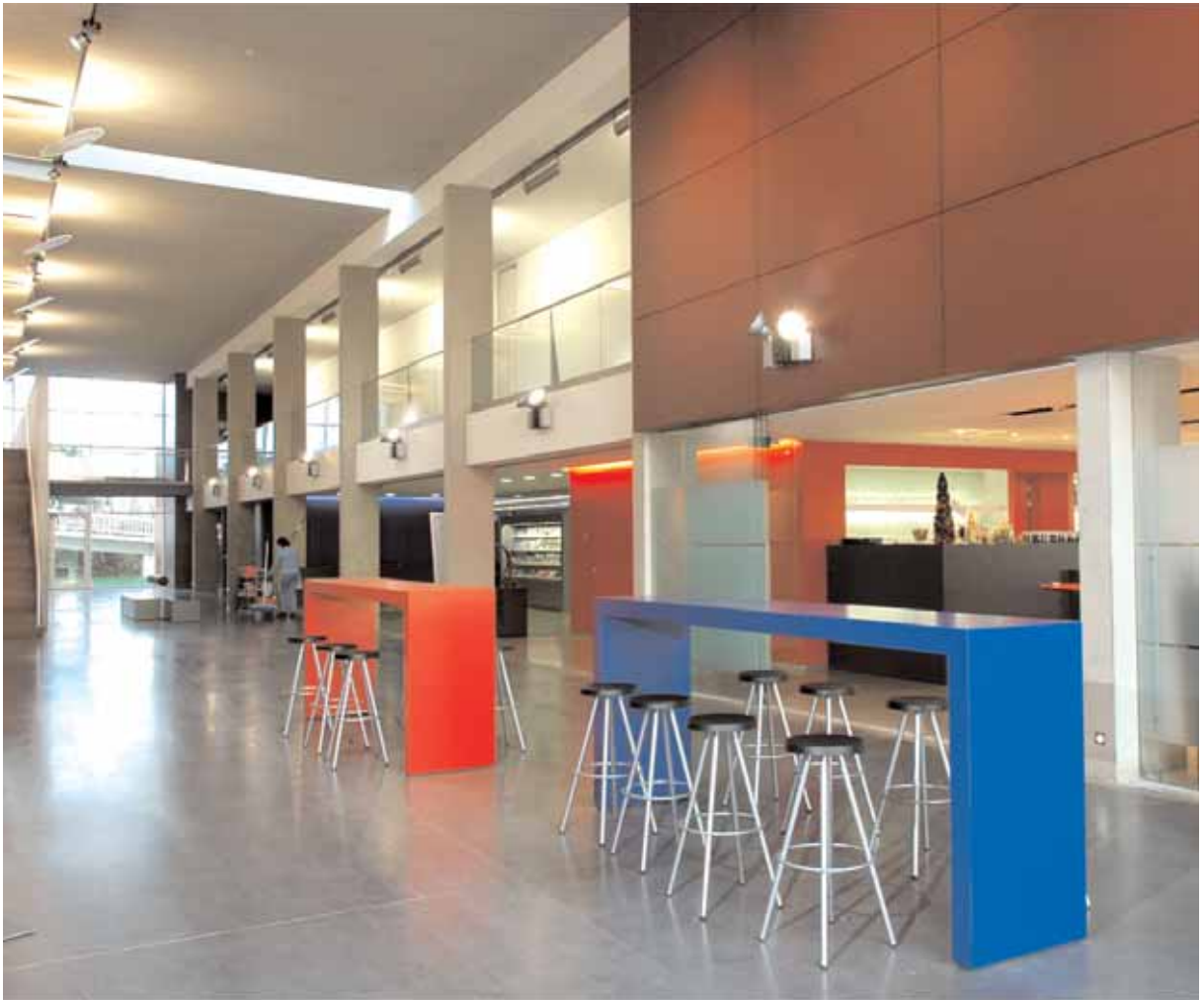
Staf Versluyscentrum architectenbureau Felix-Glorieux en atelier voor architectuur Maes-De Busschere