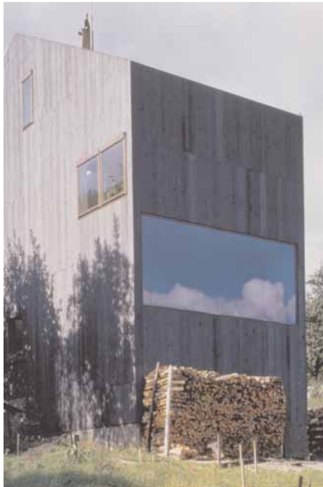
Casa Williman-Lötscher, Sevgein