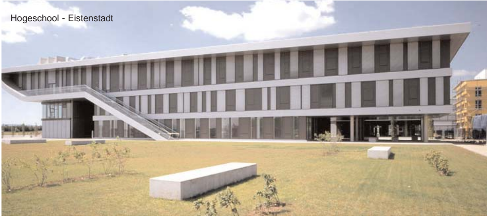
Hogeschool - Eistenstadt