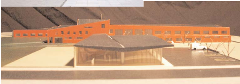
Rusthuis te Dadizele