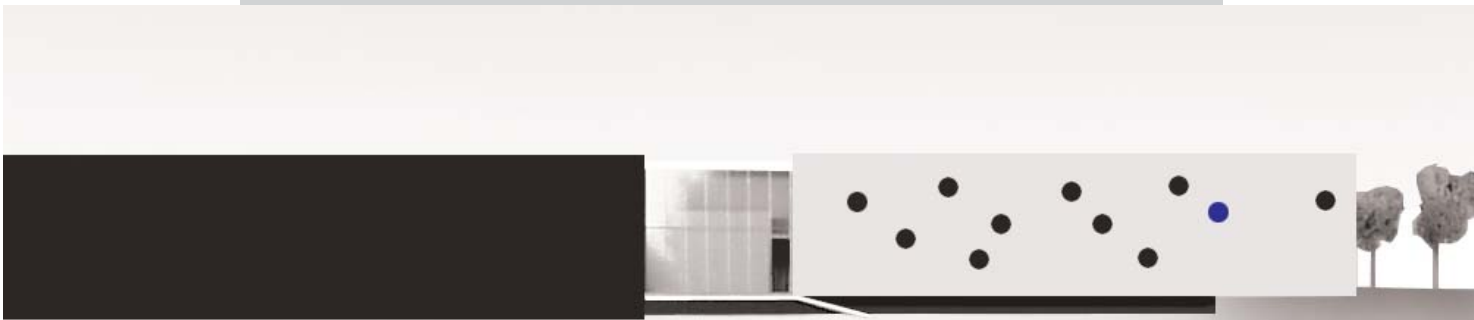
Govaert & Vanhoutte - Deltalight