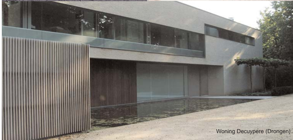
Woning Decuypère (Drongen)