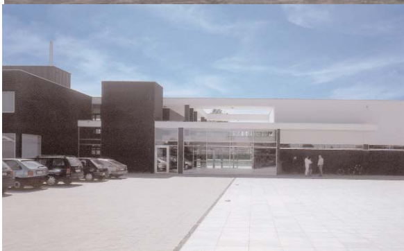
Scholengebouw te Aartrijke