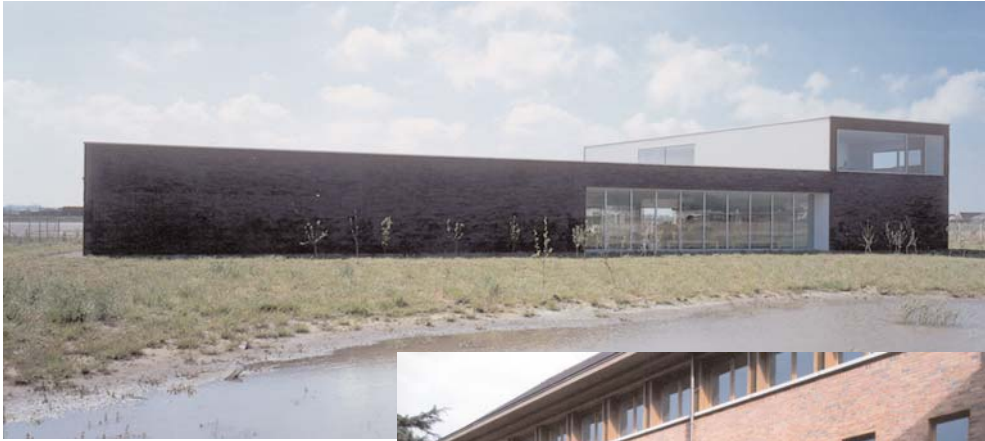
Bezoekerscentrum Walraversijde te Oostende