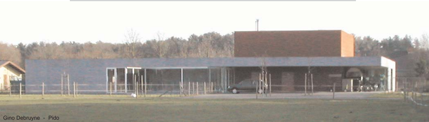
Gino Debruyne - Pido