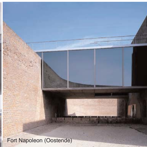
Fort Napoleon (Oostende)