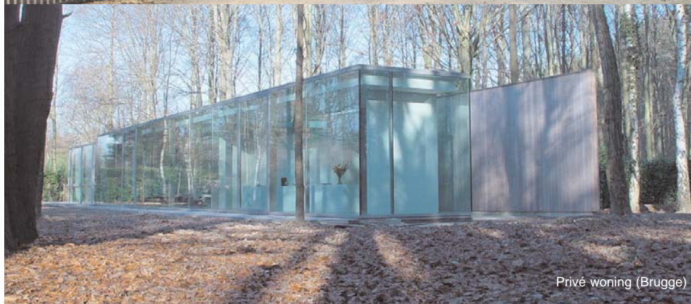
Privé woning (Brugge)