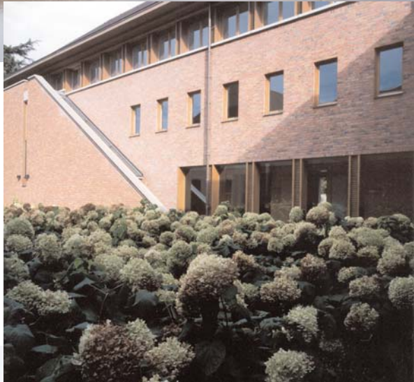
Klooster Zusters Dominicanessen te Brugge