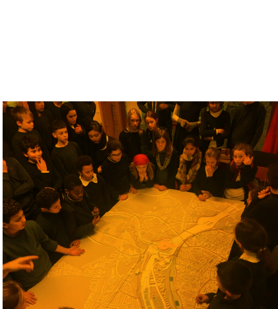
01 Over de Ring Team Oost / endeavour, SINAE en H&H+S

Gent groeit en dat veroorzaakt groepen die zich op de woonmarkt sterk laten voelen. Het resultaat vandaag in een wooncrisis met niet één uitdaging, maar verschillende uitdagingen. Bijgevolg is er niet slechts één kant-en-klare oplossing. Hoe zet men in op de grote woongebouwen, de woonopgaves en de ontwerp oplossingen? Hoe houdt men de betaalbaarheid in het oog? Na het kaderen van het woonvraagstuk in Gent worden vier verschillende woonprojecten gepresenteerd. Nadien gaan we in dialoog.