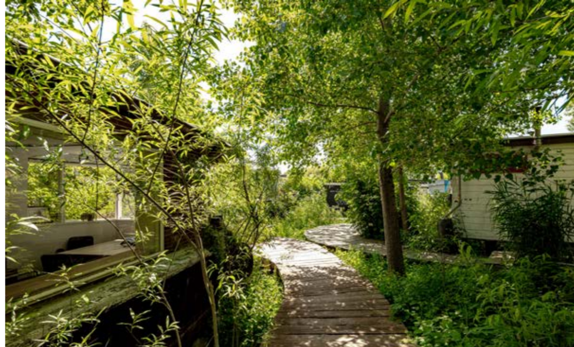
07 De Cavel, Buikloterham / DELVA Landscape Architecture & Urbanism, beeld © Sebastian van Damme