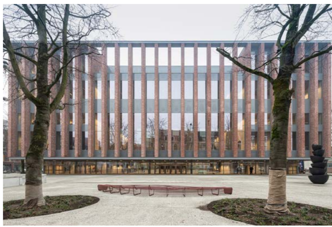
06 Beurs- Meeting- en Congressentrum (BMCC) / Eduardo Souto de Moura en META architectuurbureau

Hoe kunnen we ruimte creëren voor maakindustrie in een stedelijke context waarin vaak alle mechanismes gericht lijken op het ontwikkelen van woningen? Er is nood aan een groter verhaal over de productieve stad, met gedeelde ruimten, dat verder gaat dan alleen het vastgoedverhaal. Hoewel de woningbehoefte terecht is, moeten we waken voor een monocultuur. De maakindustrie vormt een toegevoegde waarde voor een stad. TRANS architectuur | stedenbouw is niet aan zijn proefstuk toe. Met ervaring in diverse stedelijke maakindustrie projecten in Gent onderzoekt het bureau nu ook de deelgemeente in Kortrijk. De lezing toont projecten die de maakindustrie in de stad perfect illustreren.