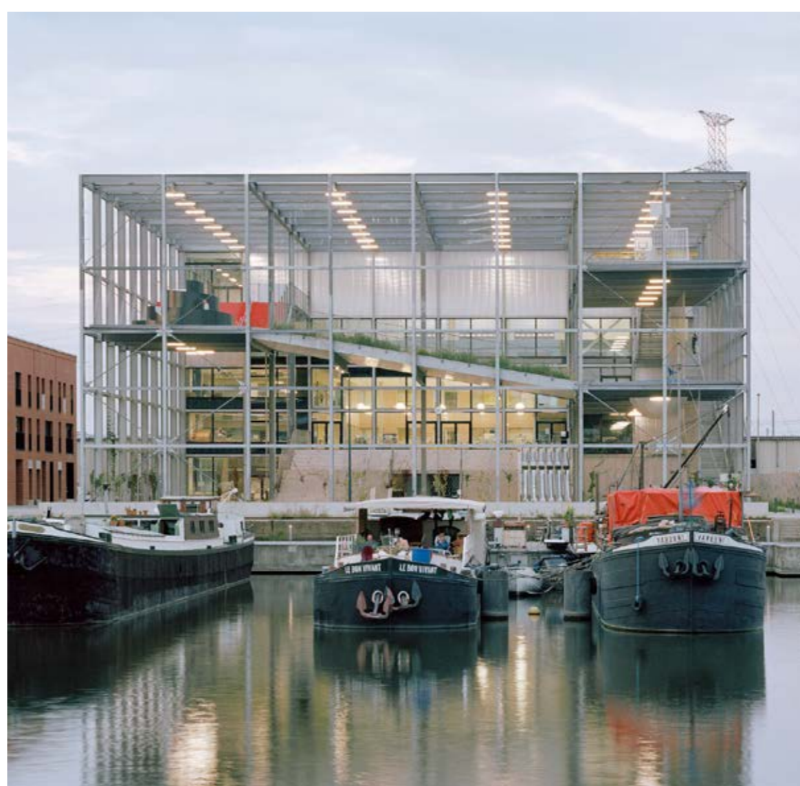
09 Mellope / DGA architecten, beeld © Maxime Delvaux