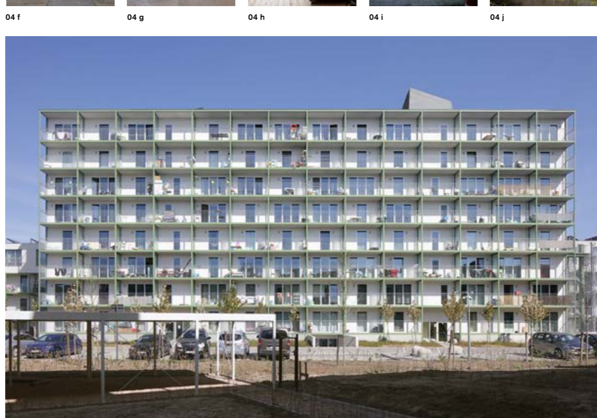
05 Nekkersput / DBLV architecten