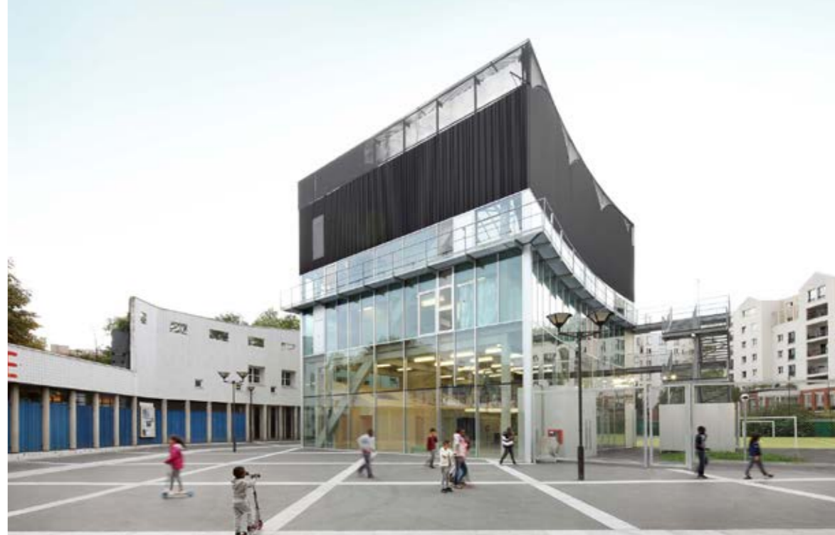
15 Cultural and Sports Center Saint-Blaise / beeld © Bruther