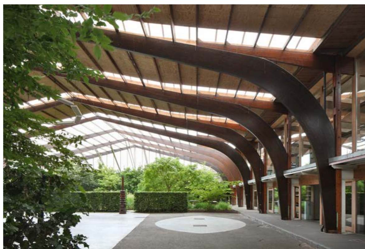
03 Kantoren Robbrecht en Daem / Beeld © Filip Dujardin

Rekening houdende met de COVID-19 situatie zetten we in 2022 in op een aantal buitenactiviteiten zoals fietstochten en/of stadswandelingen. Archipel maakt een aantal thematische architectuurkaarten om de stad per fiets of te voet te ontdekken. Oostende floreerde onder de eerste Belgische koningen en groeide tijdens de Belle Epoque uit tot één van Europa's meest kosmopolitische en mondaine kuuororden. Na de Tweede Wereldoorlog illustreerde Oostende haar vooruitstrevende, brutende imago door met de heropbouw radicaal voor moderne architectuur te kiezen. Welke sporen blijven herkenbaar? De route langsheen modernistische projecten in Oostende is tevens een oproep tot bescherming van modernistische gebouwen.