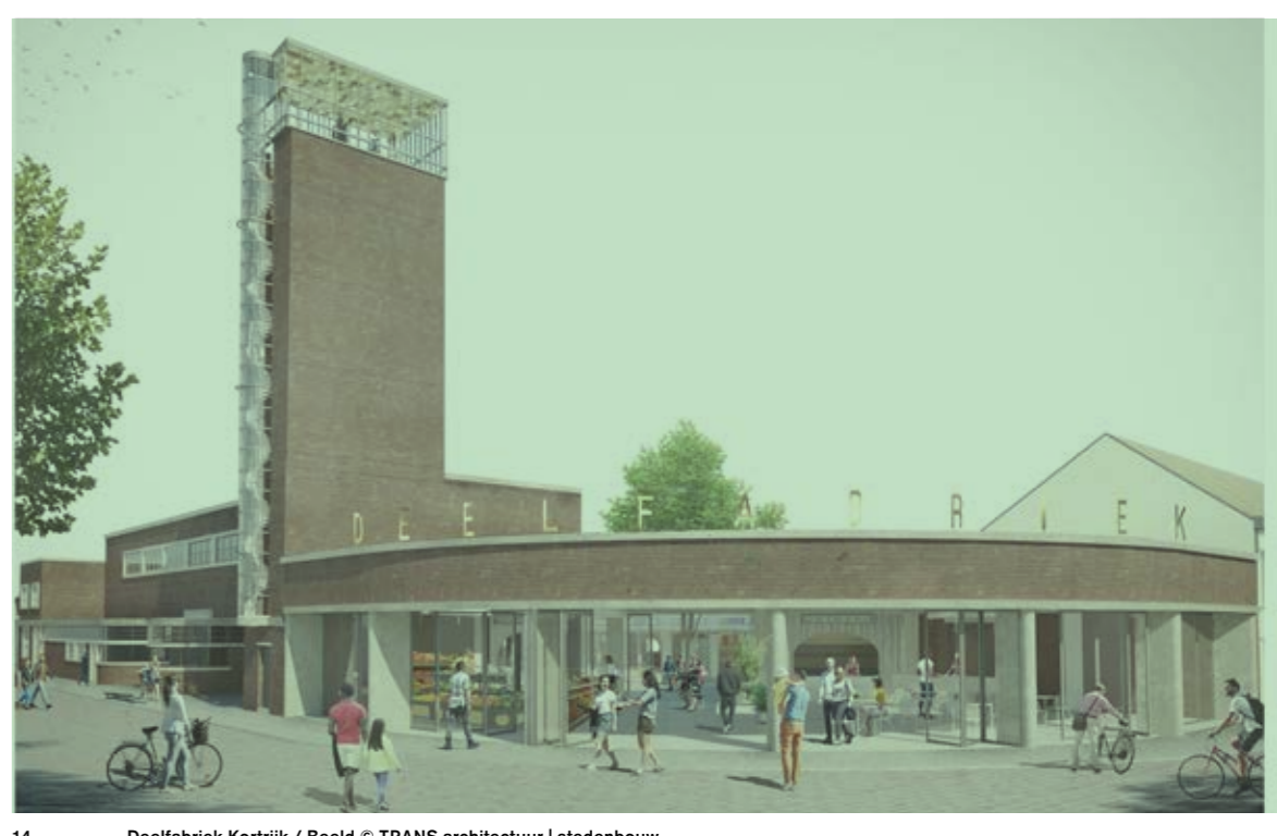
14 Deelfabriek Kortrijk / Beeld © TRANS architectuur | stedenbouw