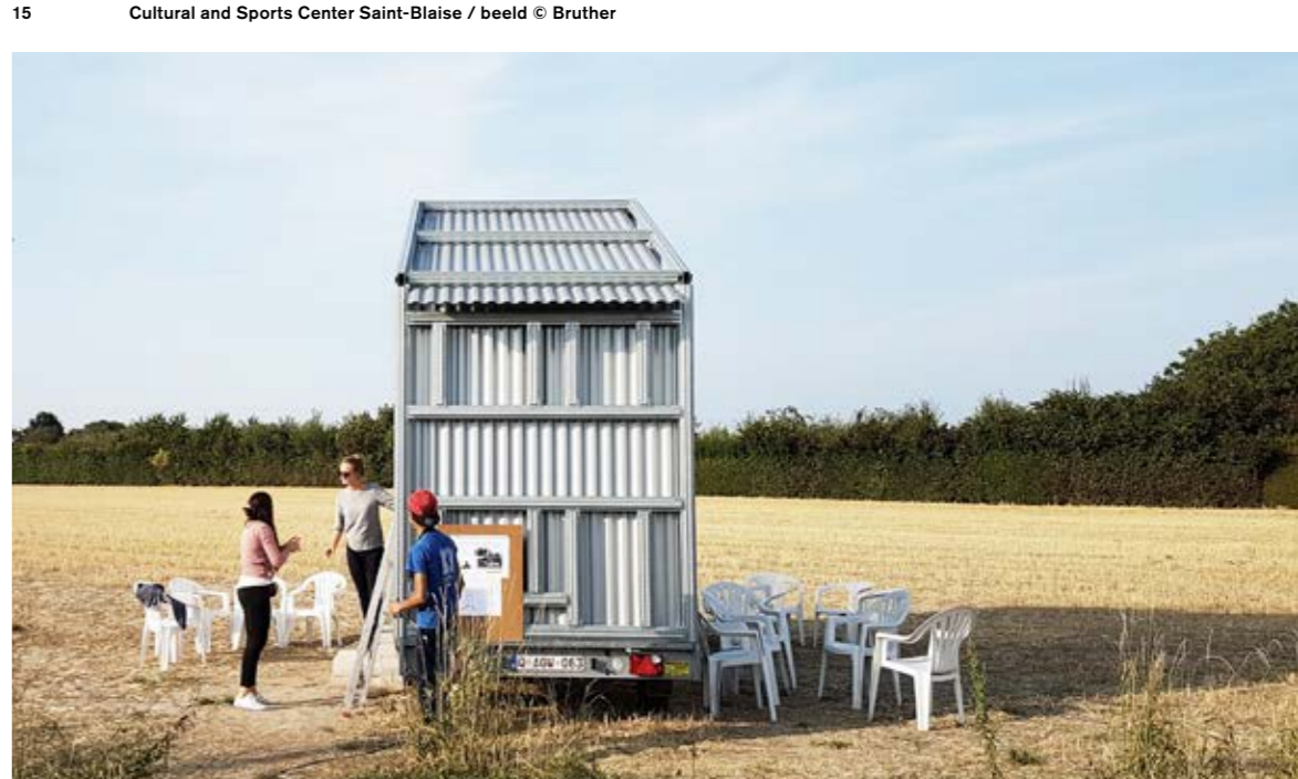
16 House for Seasonal Neighbours