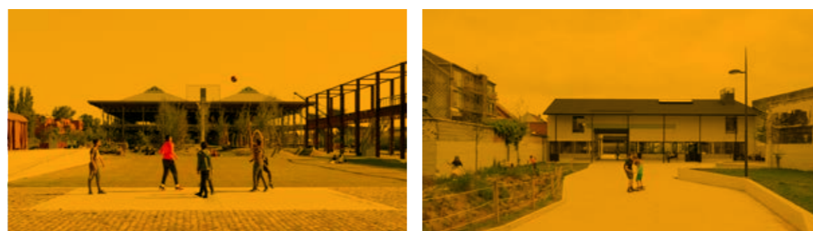
08 Links: Voorhaven L1, rechts: Standaardize