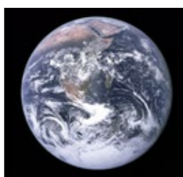
The Blue Marble is een beroemde foto van de aarde genomen op 7 december 1972, genomen door de bemanning van het Apollo 17-ruimteschip op weg naar de maan op een afstand van ongeveer 29.400 kilometer.

Roberto Flores, Flores | Prats, interview Dezeen 2018