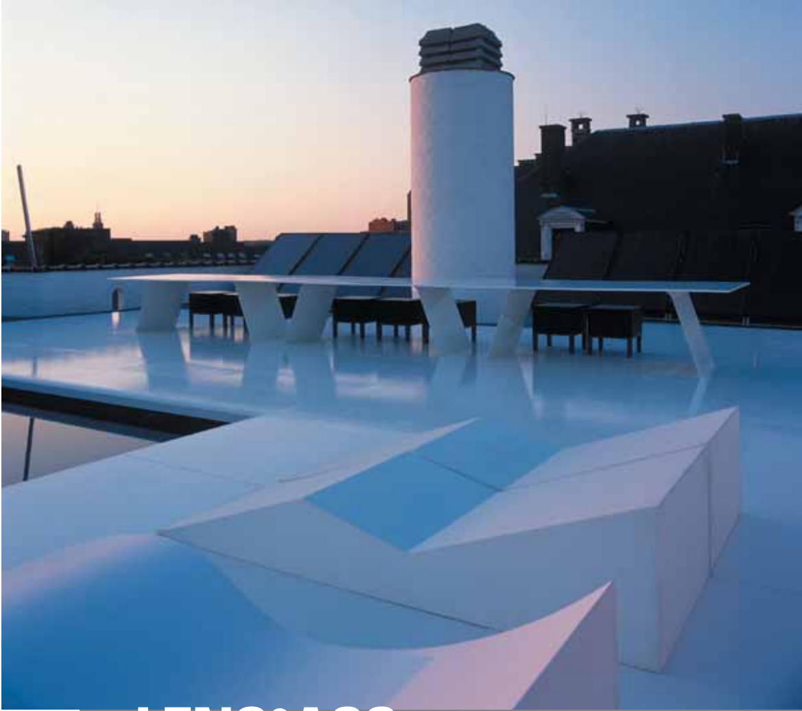
Verbouwing en herbestemming van handelspand naar Lens°ass met woonloft te Hasselt Twee varianten van 'Poolchair op voorgrond, 'T'-bel op achtergrond