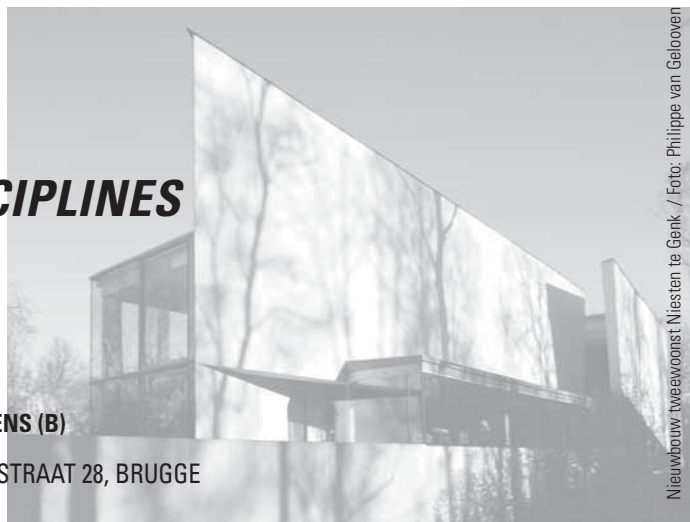
Nieuwbouw tweewoonst Niesten te Genk

VLM-ZAAL (voorheen Bacob-gebouw door S. Beel), VELODROOMSTRAAT 28, BRUGGE